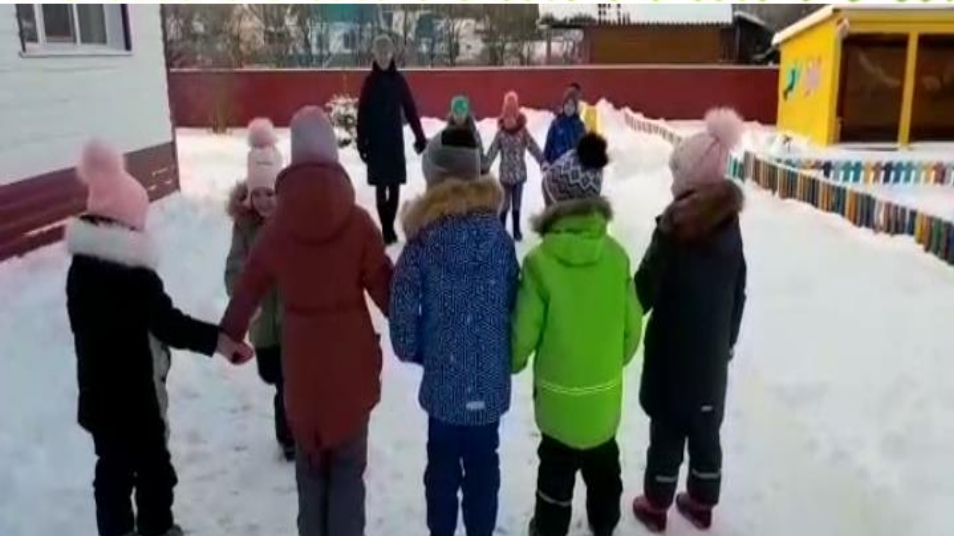
Башкорт уйыны «Ак тирәк, күк тирәк» («Белый тополь, синий тополь») мәктәпкәсә әзерлек төркөмө.